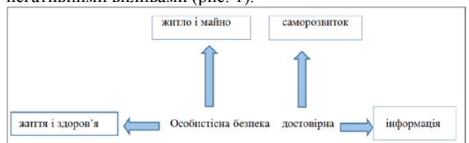
Рисунок 1 – Модель особистісної безпеки

позначені гудрони в Новому Роздолі, Грибовицьке сміттєзвалище, місця незаконної вирубки лісів і видобутку гравію (Прес-служба ЛОДА, інформаційні матеріали від 15.08.16). Особистісна безпека передбачає здатність соціально зрілої людини піклуватися про нажите майно і придбане житло, як правило, нерухомість, власний транспорт і цінні речі застраховані, на них складений заповіт або підписане доручення на право користування. Відчуті особистісну безпеку можливо за вільного розвитку соціально зрілої людини, набувши свободи дій і вибору, намагається спиратись переважно на власні сили, тримається впевнено, захоплюється творчістю. У зв'язку із загрозою суверенітету України з боку Росії зміцнилося національне почуття українців, а також інших етнічних менших, які долучилися до українських традицій, звичаїв і культури (участь у параді вишиванок, відвідування етнофестивалів, концертів, святкування державних і народних свят, збільшення вжитку українських побутових предметів та символіки), що виражається як опір деструктивним внутрішнім і зовнішнім впливам, спробам розпалити політичний, економічний або релігійний конфлікт. Соціально зріла людина прагне здобувати достовірну інформацію, тому менше дивиться телевізійні новини, віддаючи перевагу радіооглядам преси і часописам, зазвичай це місцева періодика, в цьому виявляється спроможність зберігати стійкість у середовищі з визначеними параметрами і негативними впливами (рис. 1).