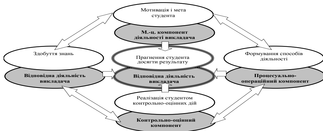
Рис. 2. Бінарна модель формування професійної компетентності майбутнього вчителя початкової школи

Один її блок відображає компоненти навчальної діяльності, яку здійснюють студенти, здобуваючи професійно-педагогічну освіту, інший відтворює освітню діяльність педагогічних працівників вищого навчального закладу, спрямовану на формування професійної компетентності майбутнього вчителя. Модельми розглядаємо як допоміжний об'єкт, цілеспрямовано створений нами із науково-пізнавальною метою для здійснюваного нами дослідження. Модель дає нову інформацію про предмет дослідження. Відомо, що моделі розподіляють на предметні та знакові. Ми використовували знакове моделювання , тобто таке, коли основою моделі є схема досліджуваного процесу, побудована за допомогою графічного редактора.