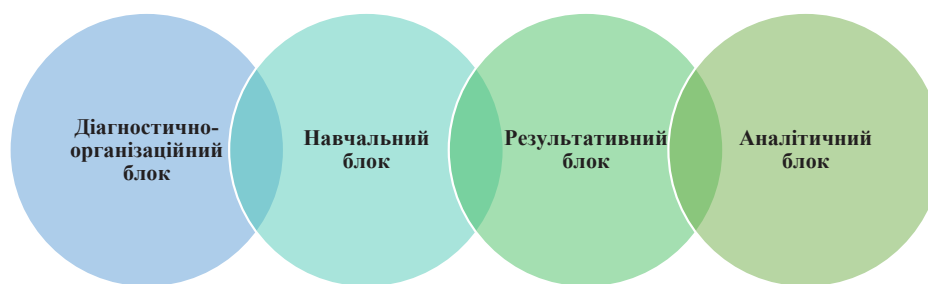
Рисунок 2. Структурні елементи моделі формування соціокультурної компетентності філологів

Метою розробки й упровадження моделі було забезпечити формування соціокультурної компетентності майбутніх бакалаврів іноземної мови на засадах міждисциплінарної інтеграції. Модель складається з чотирьох блоків (рис. 2):